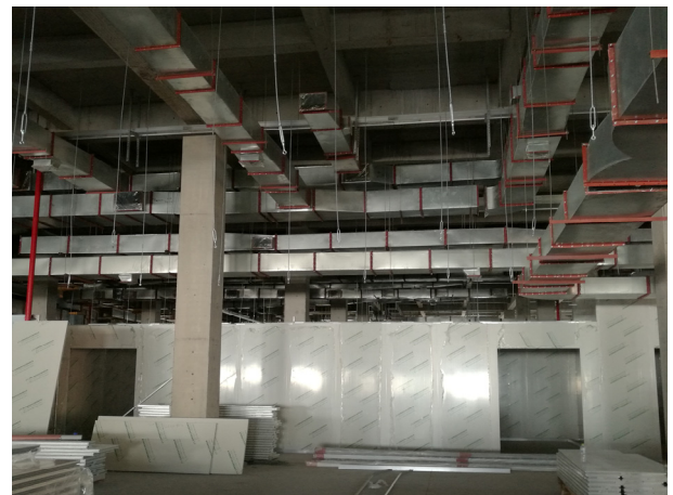
图1 某制药企业制剂车间复杂的风管布置,在设计院完成平面设计后又重新进行二次深化设计

调所相关联的数据参数与零部件尺寸,只有将上述数据收集完毕,才能更好地拉动暖通设计的合理性,为后续的设计、数据计算、内容反馈等做好铺垫。需要注意的是,在信息收集的过程之中,工作人员应当对其做出一定的筛选和整理,确保数据能够被最大化的使用与契合,才能保证建筑设计准确有效的价值。同时,暖通设计并非独立运作,工作人员还要充分考量其背后的整体建筑设计,做出合理的判断与认同后,才能更好地发挥暖通设计作用。