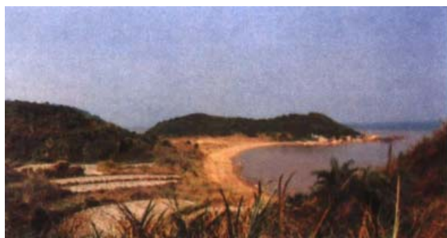
图1 淇澳后沙湾遗址

从地理位置上而言,珠海淇澳岛东望香港、深圳,处在穗港澳金三角中心,它是伶仃洋、跨海大桥的必经之道。而唐家湾镇濒临南海之滨,在历史上是一个渔业港口小镇,唐家人民临海靠海,与海洋共生,渔民历来崇拜妈祖,孕育了独特的海洋文化。