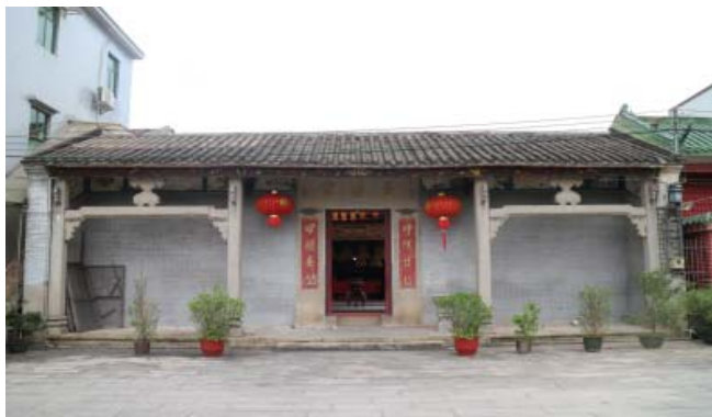
图5 淇澳岛天后宫外立面

室内三开间均有墙体分隔。主殿前设一香亭,体量较大占据庭院中间,将庭院一分为二。总体上淇澳天后宫因建设年代较早,后期多次重建和维修,在很大程度上损害了建筑空间的艺术价值。