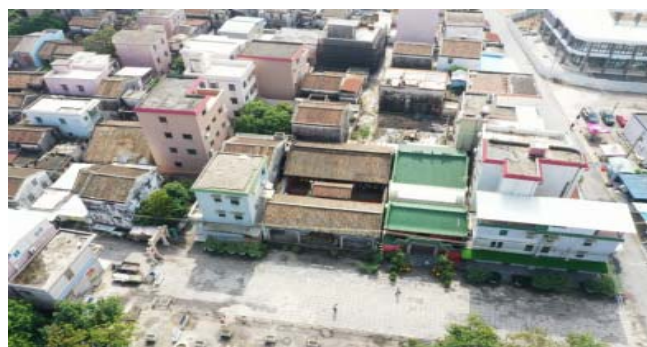
图2 淇澳岛天后宫航拍图